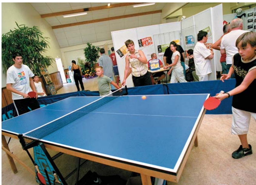
Preuve de sa volonté de rebondir : Le 3 septembre lors de la journée des loisirs, l'ASTT était présente avec une table et offrait des démonstrations.