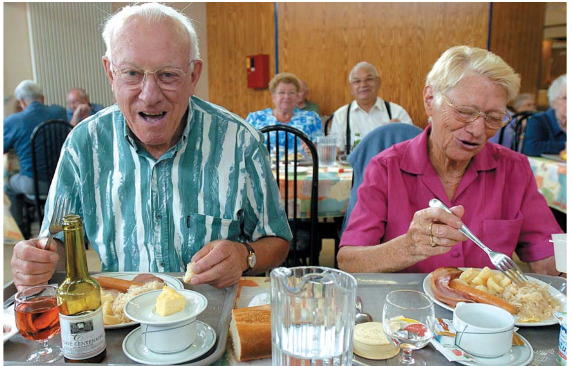
Au restaurant du foyer Bourdon.

Face au problème, un comité de pilotage a vu le jour : il réunit trois à quatre fois par an élus, responsables administratifs, professions médicales, partenaires de la Ville pour