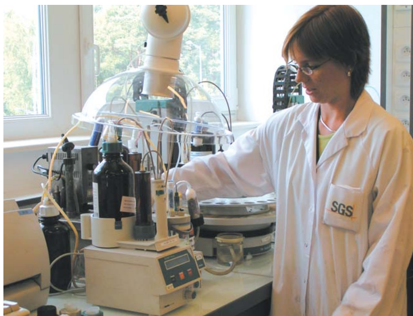
Dans le laboratoire de chimie organique.

SGS est leader mondial des expertises et certifications chimiques. Ses missions ? La recherche de pesticide dans les produits alimentaires ou de radioactivité dans les produits agricoles importés, la vérifica-