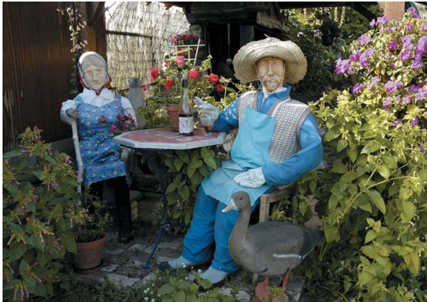
Un jardin fleuri... et habité.

Vendredi 30 septembre, 600 familles stéphanoises ont rendez-vous à la salle festive pour les résultats du concours Fleurir la ville.