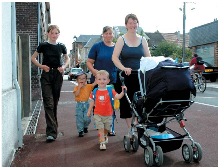
Des trottoirs confortables, rue de la République.