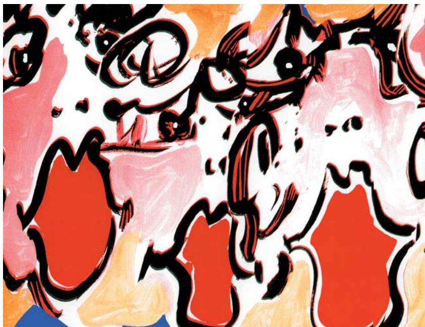
Apprendre à chanter en chœur. dessin de D.Y.Coat.

Autre nouveauté, un cours d'écriture de partition complètera les cours de formation musicale. Il constituera une sorte de travaux pratiques pour comprendre une partition et apprendre à en composer. C'est un cours optionnel accessible aux élèves de niveau 5 en formation musicale dont l'ensei-