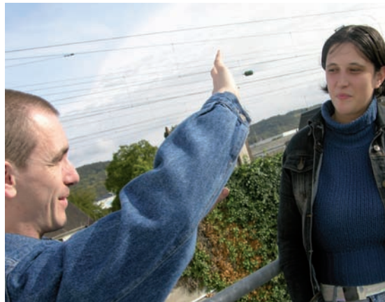
Les deux complices tournent actuellement leur troisième film.

Défi relevé sans complexe puisque les complices affichent déjà deux courts-métrages au compteur: «un thriller fantastique» Rendez-vous , et un film d'animation bricolé sur un logiciel de dessin industriel.