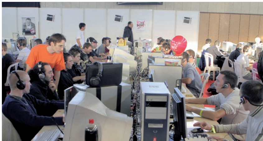
Tout le week-end, 180 passionnés de jeux en réseau se donnent rendez-vous au gymnase Paul-Eluard.

• Fête des nouvelles technologies , samedi 18, de 10 à 18 heures, gymnase Paul-Eluard. Entrée libre.