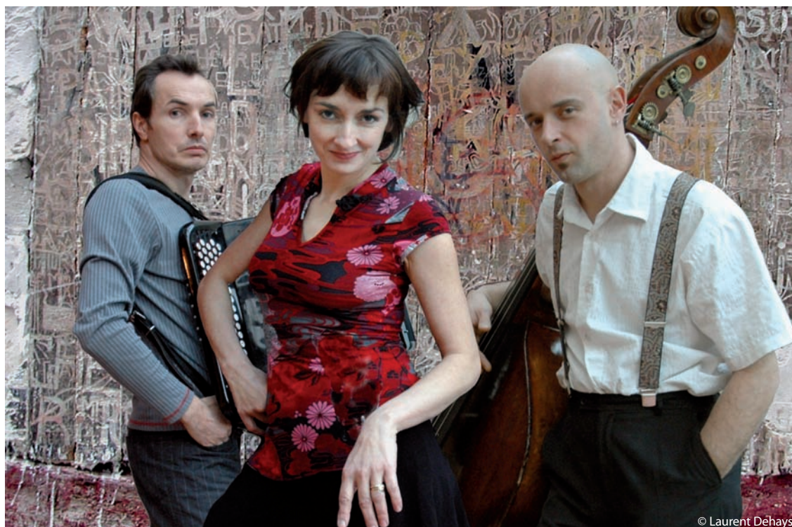
Le groupe La mauvaise réputation revisite Brassens sans toucher aux textes.

Les petits chanteurs de Langevin seront sur la scène de la salle festive le 22 novembre pour interpréter ensemble, en ouverture et en clôture du concert de La Mauvaise réputation, un groupe normand qui continue à