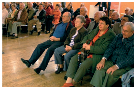
Un comité de parrainage en faveur de l'Ehpad se constitue.

Cette mobilisation fait déjà réagir : le directeur départemental de l'action sanitaire et sociale a expliqué dans la presse que le projet était «pertinent» mais que les budgets étaient limités. Il y a pourtant urgence. Et s'il en fallait une preuve supplémentaire, le gouvernement a décrété la prise en charge de la maladie d'Alzheimer grande cause nationale en 2007. ♦