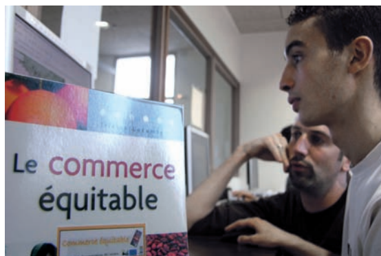
Huit lycéens ont préparé une exposition pour les bibliothèques.

À la veille de l'ouverture du festival du livre de jeunesse de Rouen, les bibliothèques illustrent le thème de cette année: le développement durable. Du 15 novembre au 2 décembre, une exposition du photographe Yann Arthus-Bertrand, rendu célèbre par ses clichés pris du ciel, sera installée au premier étage de l'espace Georges-Déziré. Plus originale, la seconde exposition est proposée par huit lycéens en Contrat partenaires jeunes autour de la question: «Quand notre alimentation