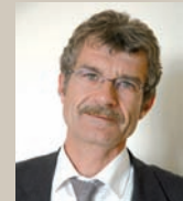
Hubert Wulfranc maire, conseiller général

en discuter avec vous lors des deux réunions publiques les 20 et 22 novembre et auxquelles j'ai le plaisir de vous inviter. Votre avis, votre contribution nous est indispensable pour construire ensemble la ville de demain.