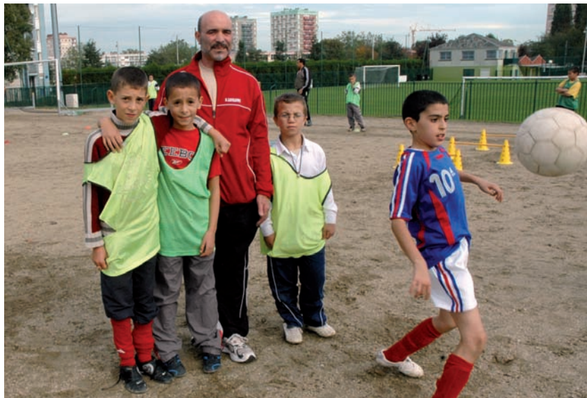
L'ASMCB mise sur un encadrement renforcé pour accompagner les jeunes du club.

Autre coup de pouce, la subvention versée par la Direction départementale jeunesse et sport dans le cadre du Plan banlieue «pour lutter contre la violence et proposer des activités aux enfants pendant les vacances».