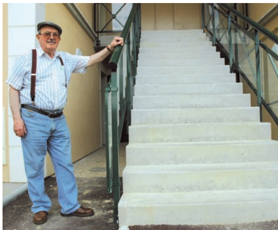
Le quartier des Cateliers s'enrichit d'une trentaine de familles.

Pour beaucoup des locataires, le trajet a été court