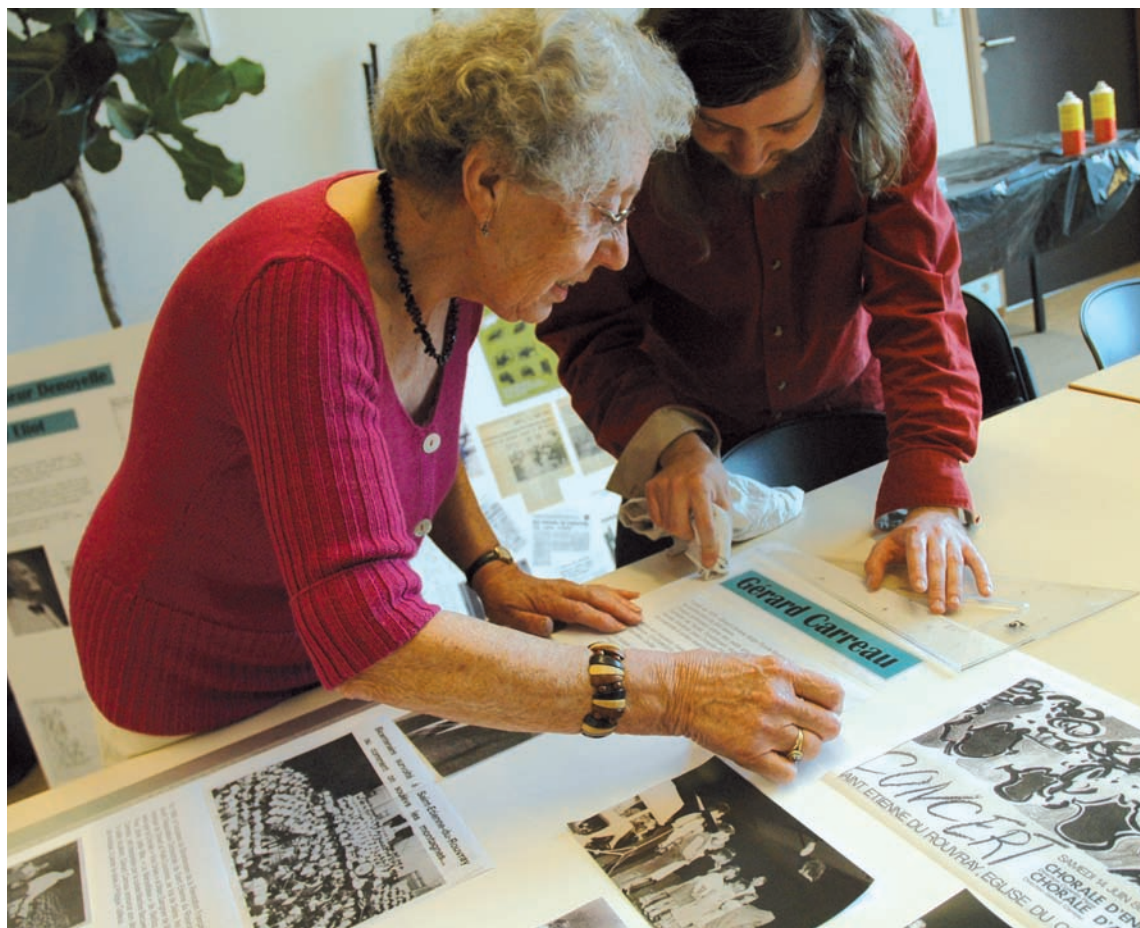
Une vingtaine de panneaux retracera les 140 années de pratiques musicales stéphanoises.