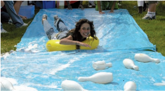
Surf sur gazon au parc Gagarine.