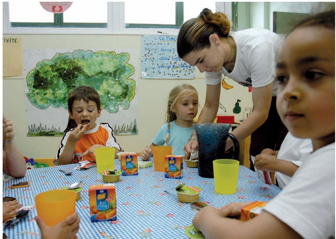
La garderie Langevin, créée en 2005. Une structure identique ouvre à Duruy, à la rentrée.

Dans quelques jours, le 4 septembre, les Stéphanois les plus jeunes vont reprendre le chemin de l'école, et retrouver les profs et les copains. Quelques nouveautés les attendent à Duruy, à Langevin et à Ampère.