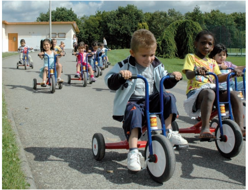
Invasion de tricycles au parc omnisports.