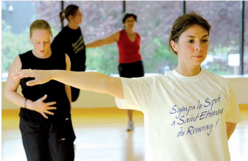
Pour la saison 2006-2007 le dispositif Sport pour tous comptait 1 625 inscrits.

Le traditionnel cours d'abdos/fessiers est dorénavant décliné en taille/abdos et en cuisses/abdos/fessiers. À côté des cours de step et d'aérobic, le service des sports propose un cardio-sculpt, du renforce-