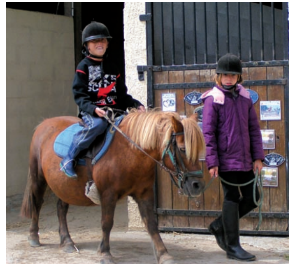
Poney à Saint-Pierre-Azif.