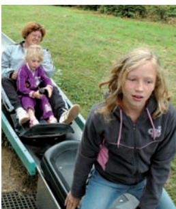
Sortie au lac de Caniel.