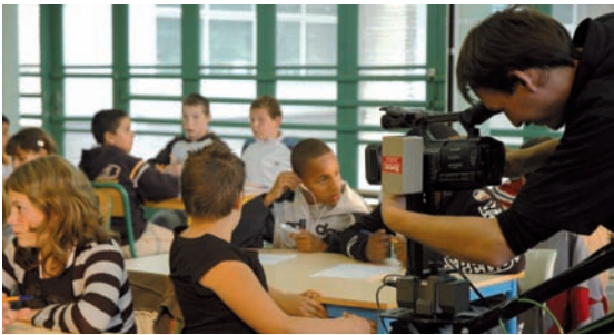
Silence ! On tourne au Périph' !