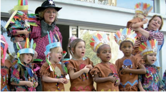
Les Indiens sortent de leur réserve à Langevin.