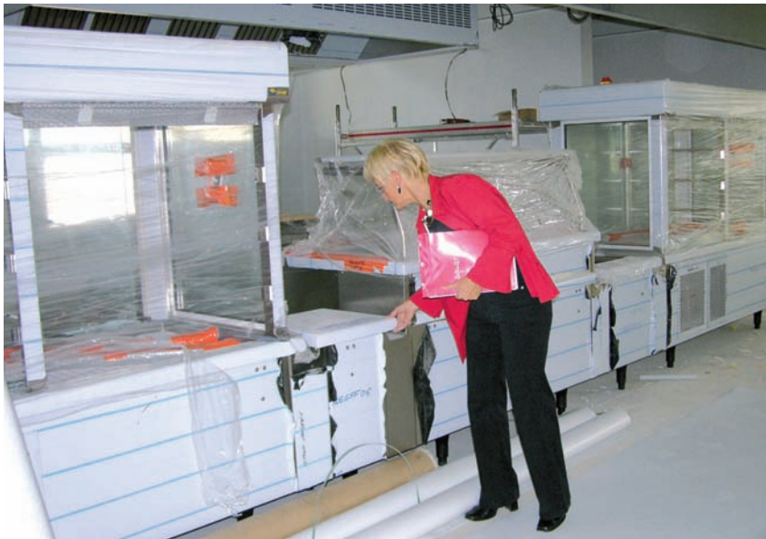
Le service des restaurants municipaux prend livraison des nouveaux matériels de cuisson des cantines scolaires, cet été.

→ sur les deux écoles, maternelle et primaire, a confirmé qu'elle serait utilisée par plusieurs familles.