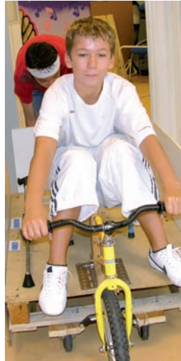
Caisse à savon...

Indiens et cow-boys, rodéos à tricycle, luge d'été, sorties en mer et pique-niques, l'été stéphanois a été radieux et chaleureux... À défaut d'avoir été ensoleillé.