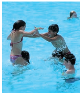
Courts séjours dans le Calvados. Le plein d'activités : piscine à Houlgate et croisière à Dives-sur-mer.