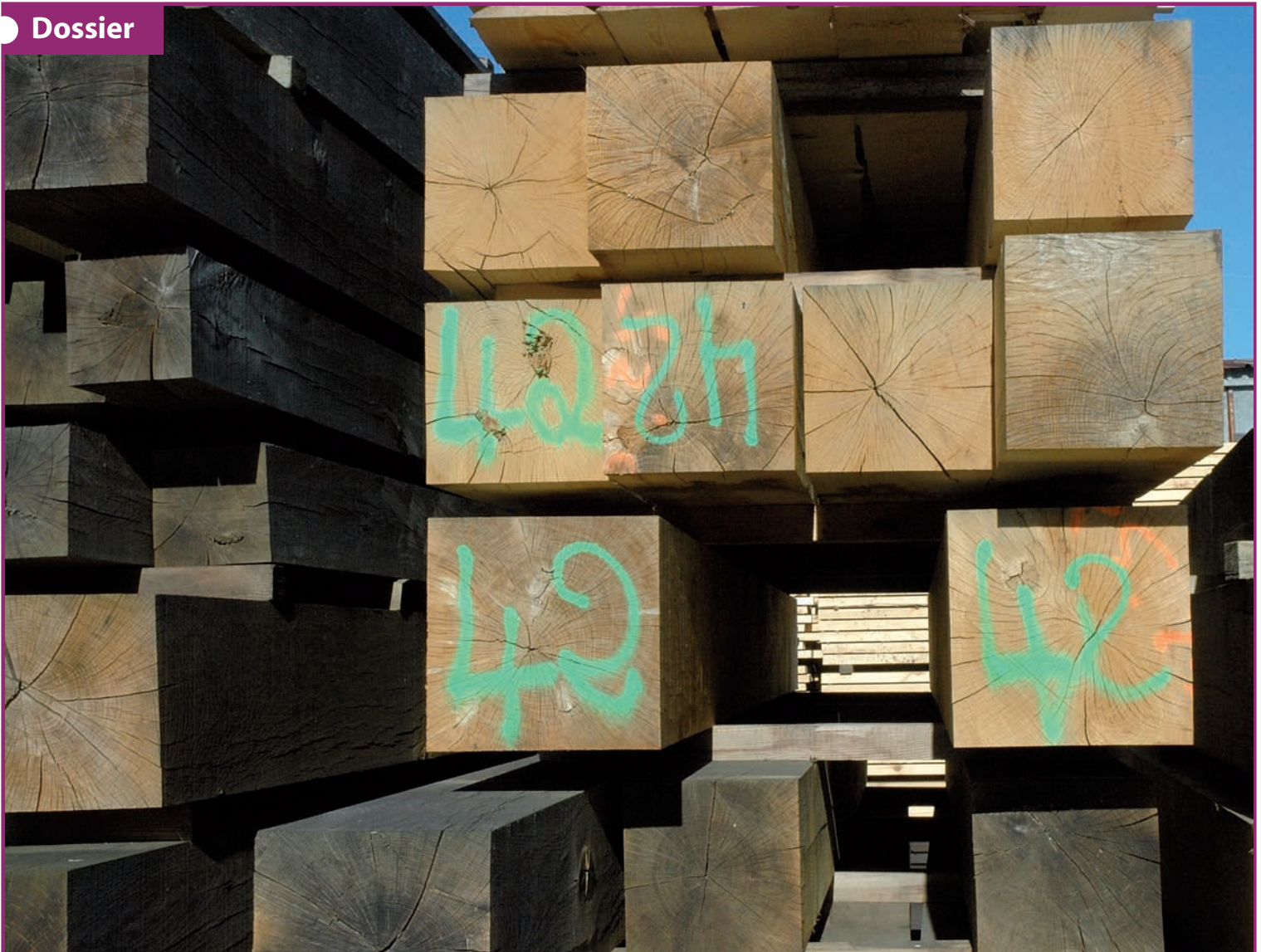
À la scierie stéphanaise Normandie Bois, des poutres de bois de construction attendent d'être livrées...