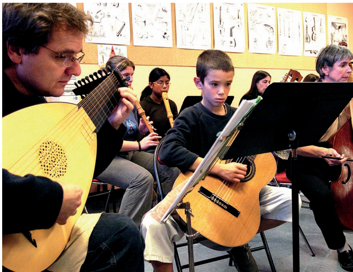
Le département de musique ancienne du conservatoire est très réputé dans l'agglomération.

Le conservatoire de musique et de danse y consacre deux soirées , les 28 et 29 mars. Vendredi 28 mars, la soirée rassemble les musiciens de Saint-Étienne et Grand-Couronne autour des compositions de Playford, Dowland, Johnson et Daniell, avec ensemble de guitares, chant, duo de luths. Samedi 29, le concert déborde vers la musique baroque avec la chorale d'adultes chantant le Magnificat de Pachelbel, les ensembles de musique de chambre et un quintet de violes joueront Sammartini, Vivaldi et