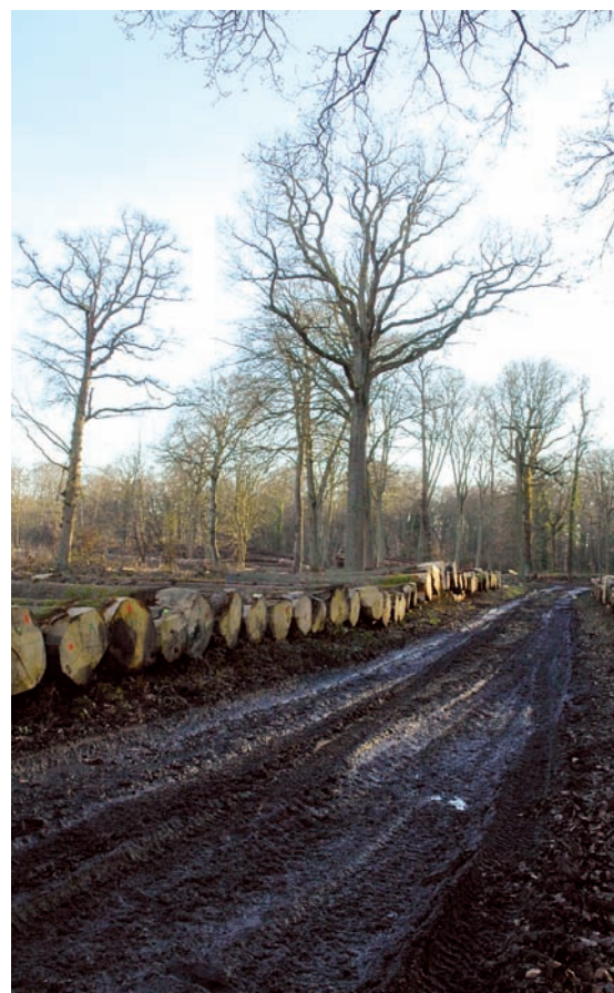
Aux Essarts, les grumes attendent d'être livrées aux scieries...

la fois avec écologie et avenir, c'est bien celui du bois, semble-t-il. Et Saint-Étienne-du-Rouvray est en pole position , à en juger par la candidature déposée récemment par le Centre régional de la propriété forestière de Normandie (CRPF) pour installer un «pôle de compétence interprofessionnel et interrégional» sur le technopôle du Madrillet... ♦