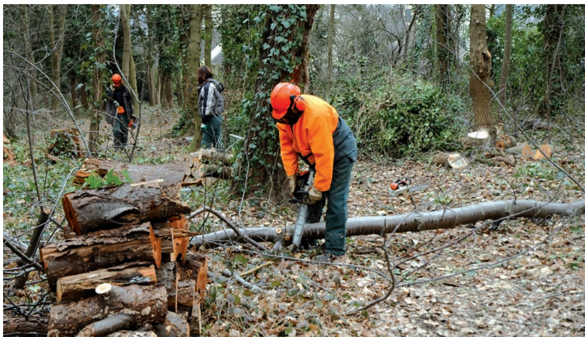
Le bois est débarrassé de ses branches menaçantes afin d'en sécuriser l'accès.