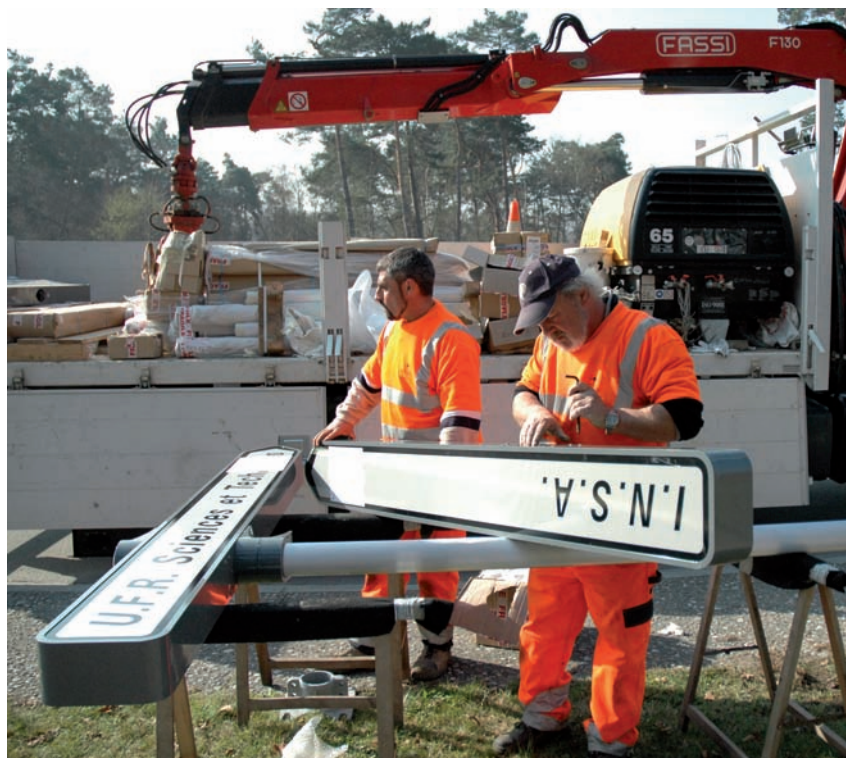
Pose des premiers panneaux au Technopôle.

« La grande contrainte est de ne pas avoir trop d'informations aux carrefours, sinon l'usager hésite, ralentit ou