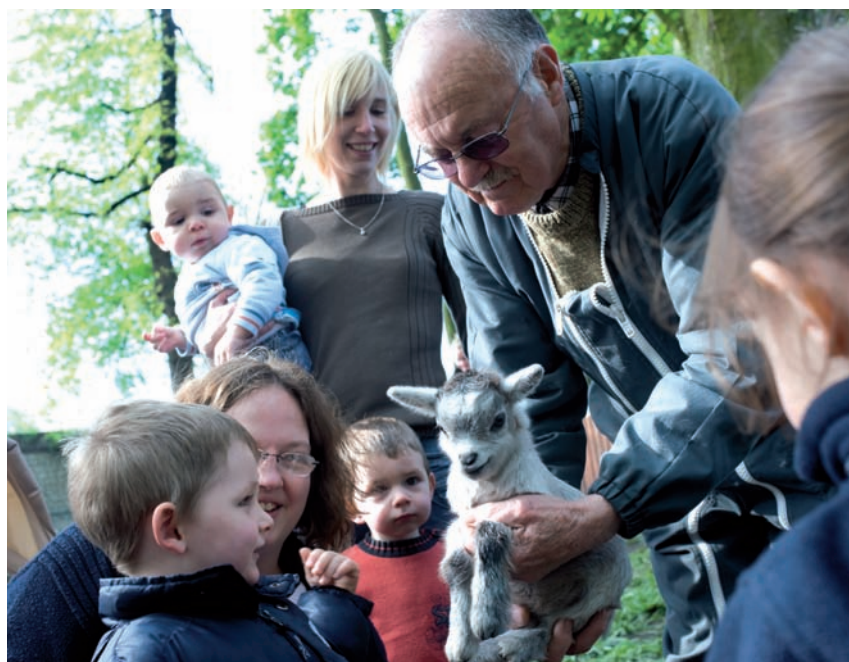
Les ateliers d'activités pour les tout-petits font le plein, tout comme les sorties. Ici à la mini-ferme de Petit-Quevilly.

• Maison de la famille , espace Célestin-Freinet, 19 avenue Ambroise-Croizat, 0232951626 ou aherpin@ser76.com