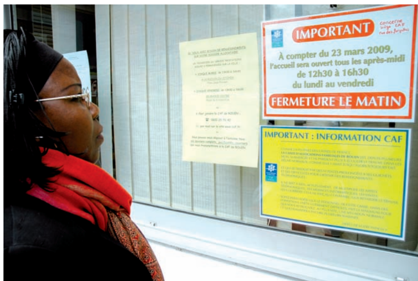
Afin de permettre à ses agents de traiter les nombreux dossiers en retard, la Caf de Rouen a décidé de fermer des accueils le matin.