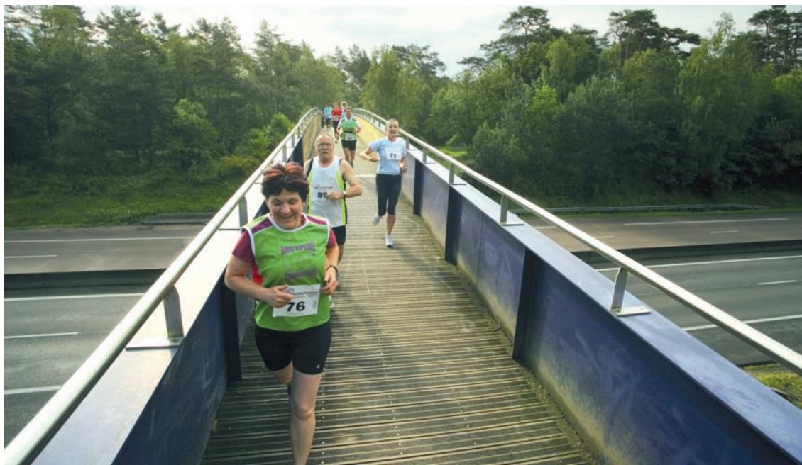
Hommes, femmes, amateurs ou professionnels, la course de la Passerelle séduit de très nombreux athlètes.

Tous deux ont un point commun : ils ne manqueraient le cross de leur ville pour rien au monde. « La forêt stéphanoise est mon terrain de jeu, sourit le jeune