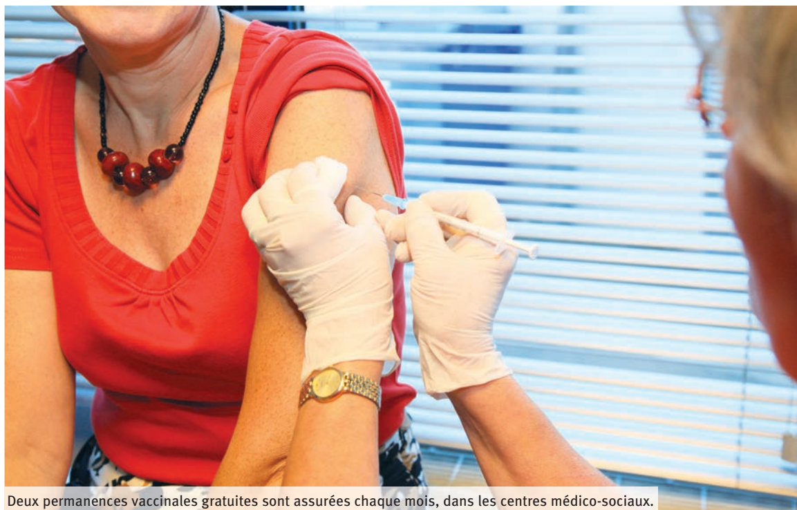
Deux permanences vaccinales gratuites sont assurées chaque mois, dans les centres médico-sociaux.

Tandis que le vaccin contre la grippe sera à nouveau bientôt d'actualité, il paraît essentiel de revenir sur les évolutions dont profite le calendrier vaccinal depuis cette année. Tous les âges de la vie sont concernés et en premier lieu les nourrissons. Dans un souci de simplification, il suffira désormais de retenir une seule et même périodicité à 2 mois, 4 mois et 11 mois pour les cinq doses qui protègent contre la diphtérie, le tétanos et la poliomyélite (DTP), la coqueluche, l'hæmophilus influenzae de type b (HIB), le pneumocoque et l'hépatite B. Toujours au chapitre des nouveautés, l'administration de la première dose du ROR contre la rougeole, les oreillons et la rubéole est préconisée à 12 mois, avec un rappel entre 16 et 18 mois, « car nous nous sommes rendu compte que l'efficacité du vaccin était moindre s'il était injecté trop tôt ». Chez l'enfant et l'adolescent, un rappel de coqueluche est inscrit à 6 ans et entre 11 et 13 ans, en même temps que le DTP. Pour les filles, la vaccination contre les infections à papillomavirus humains (HPV) est désormais recommandée dès 11 ans et jusqu'à 14 ans. Pour les adultes, tout se joue dès 25 ans. « C'est un âge clef à partir duquel il est vivement conseillé de faire ses rappels de DTP et de coqueluche, en particulier