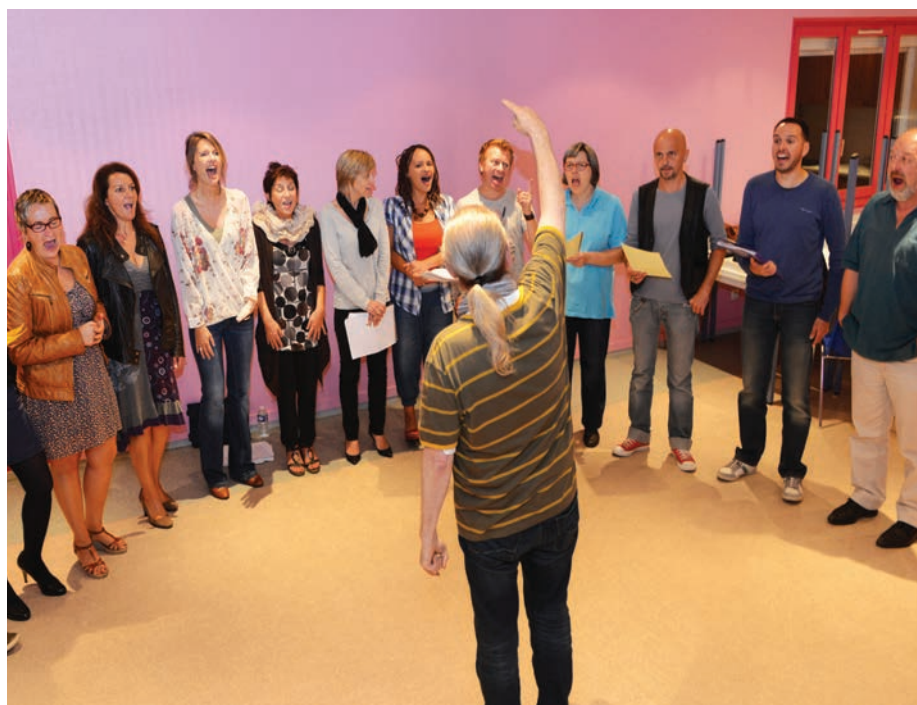
Le Broadway's gospel group est composé d'une vingtaine d'amateurs passionnés.

• Concert vendredi 11 octobre à 20 h 30. Entrée : 6,80 €, gratuit pour les moins de 12 ans. Stage samedi 5 octobre de 13 h 30 à 17 h 30. Participation : 5,70 € pour les Stéphanois, 12,10 € pour les extérieurs. Espace Georges-Déziré, 271 rue de Paris. Renseignements et réservations au 02 35 02 76 90.