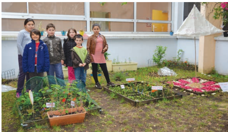
Les jardins d'herbes aromatiques et jardin zen des CM2 de l'école Louis-Pergaud, primée l'an dernier.