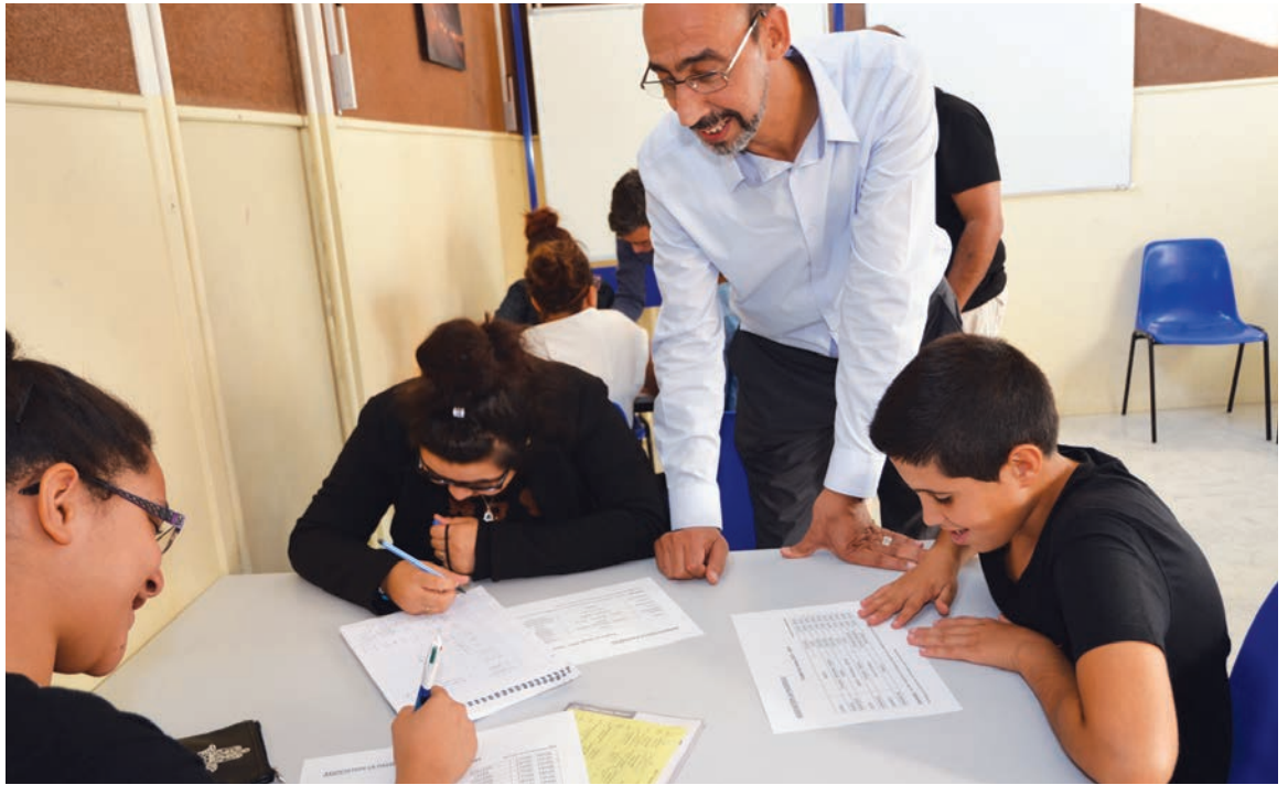
L'année dernière, 126 jeunes sont venus à la Passerelle.

L'accueil fonctionne tous les soirs, certains jours sont réservés aux collégiens, d'autres aux lycéens. « Des