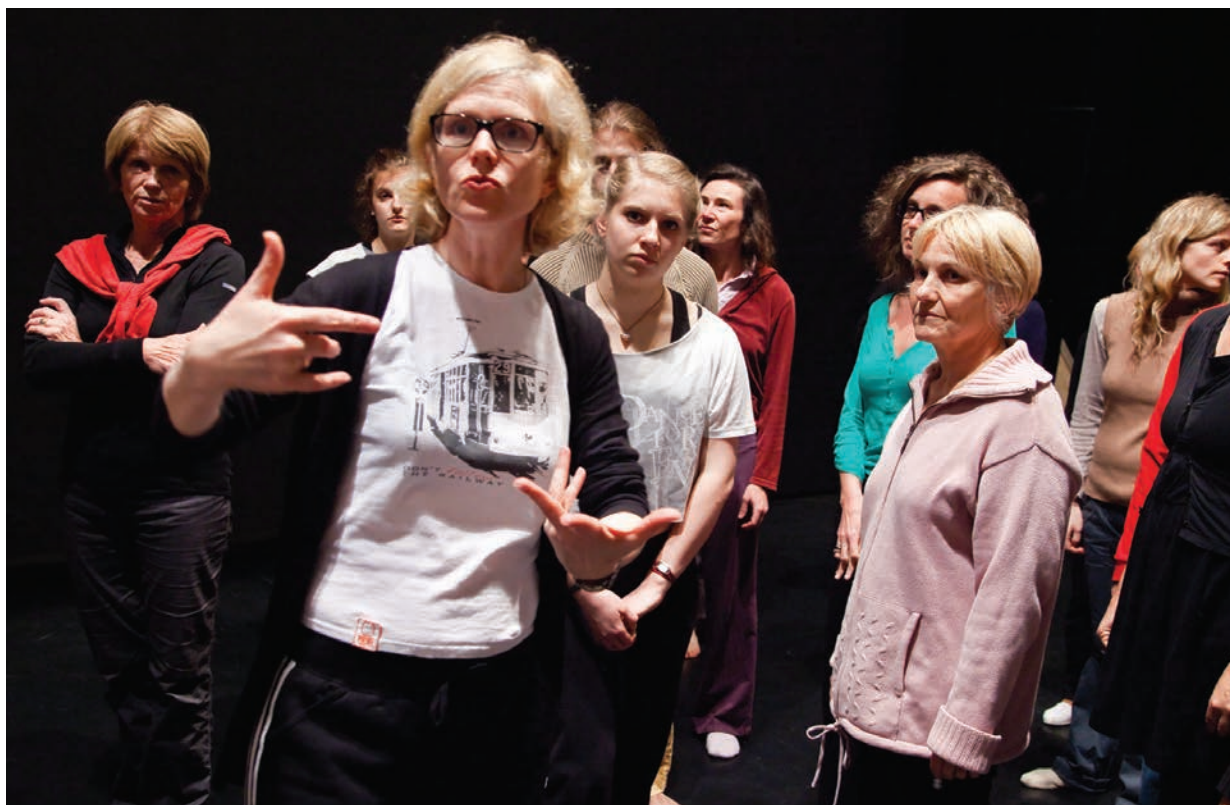
Les ateliers se dérouleront sur six jours, l'implication et la motivation des participants sont donc primordiales.