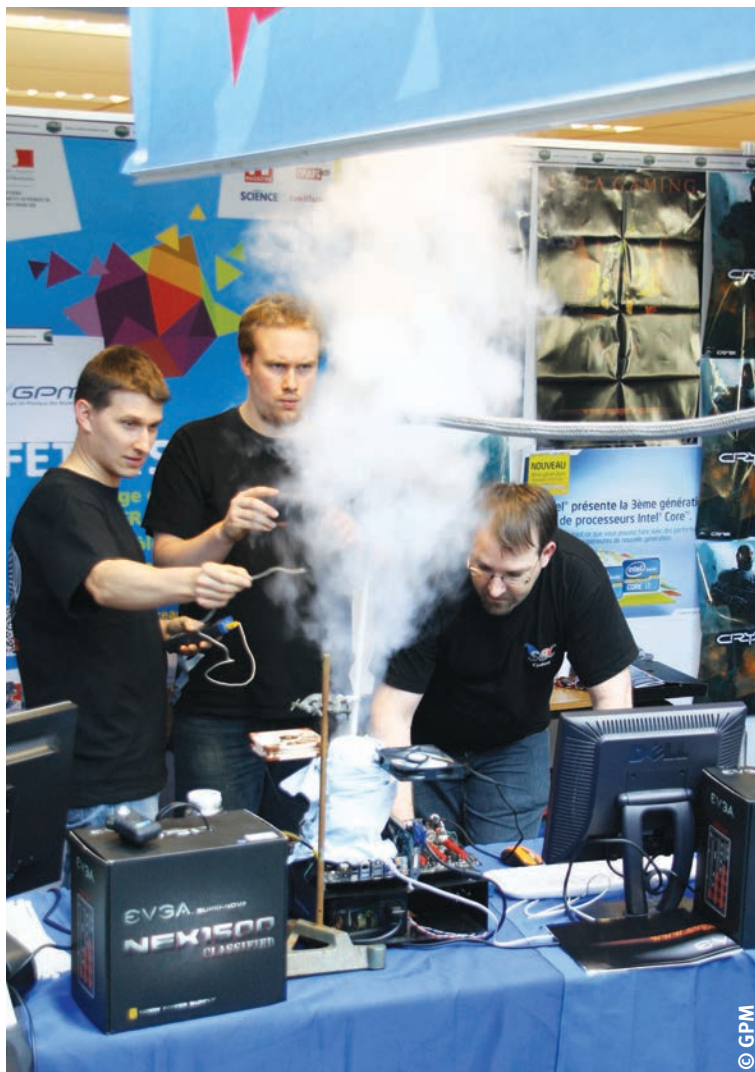
Un groupe d'experts en électronique et en informatique poussera un microprocesseur dans ses ultimes retranchements de puissance sans le faire griller.