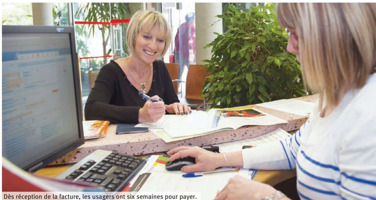
Dès réception de la facture, les usagers ont six semaines pour payer.

Pour bénéficier de la tarification solidaire, vous devez faire calculer votre quotient familial. Si ce n'est pas encore fait, rendez-vous avant le 11 octobre à un guichet Unicité avec votre avis d'imposition ou votre justificatif d'impôt sur le revenu et votre attestation CAF, notamment si vous touchez le revenu de solidarité active (RSA) ou l'allocation aux adultes handicapés (AAH). Une formule prévoyant le paiement en trois fois est possible pour le sport, les centres