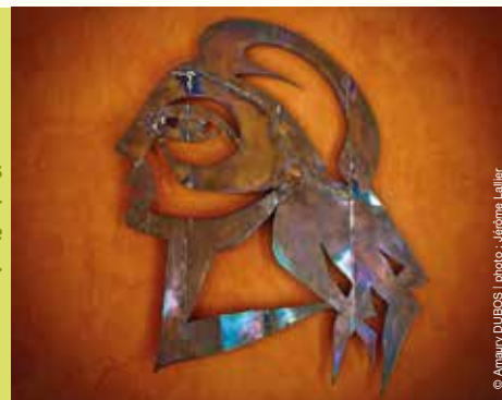
© Anamary DUBOIS | photo : Jérôme Lallier

...❖ Le Rive Gauche . Exposition visible de 13 h à 17 h 30 du mardi au vendredi et les soirs de spectacle. Renseignements au 02.32.91.94.94.