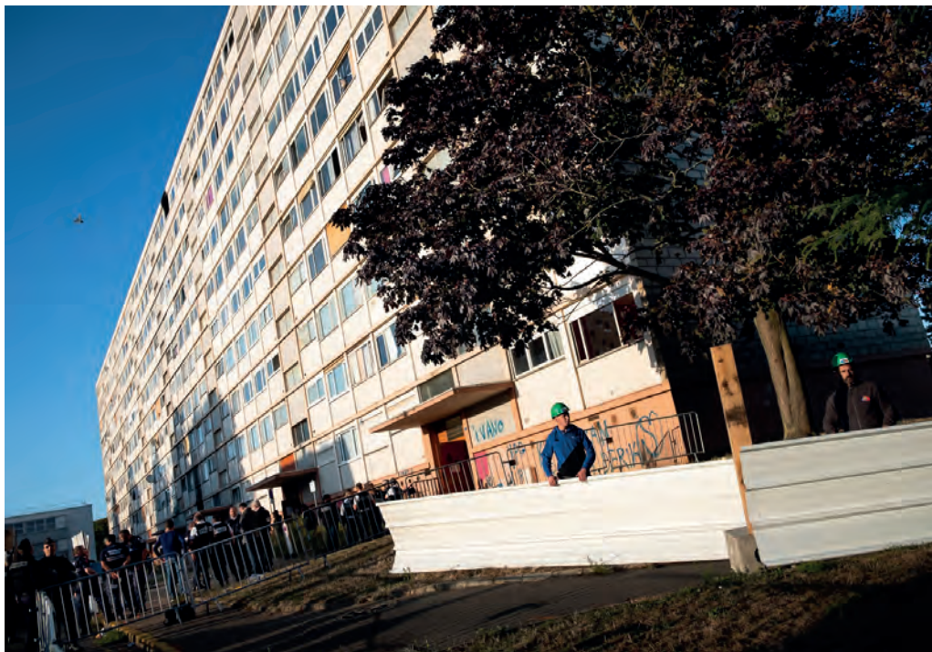
Le 23 septembre, une palissade était dressée autour de Sorano. L'immeuble est désormais inaccessible.