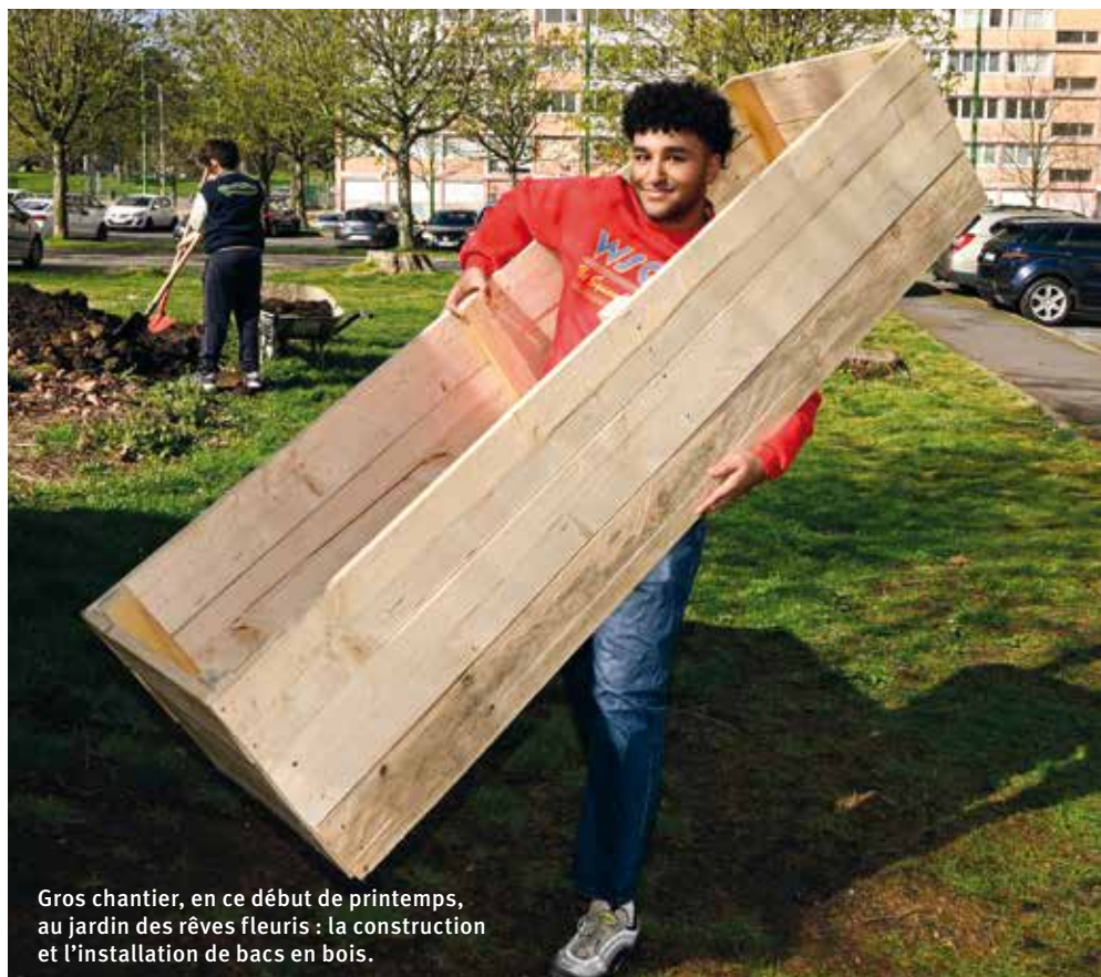
Gros chantier, en ce début de printemps, au jardin des rêves fleuris : la construction et l'installation de bacs en bois.