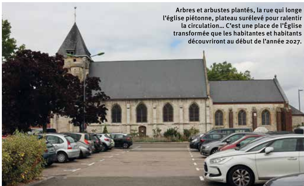
Arbres et arbustes plantés, la rue qui longe l'église piétonne, plateau surélevé pour ralentir la circulation... C'est une place de l'Église transformée que les habitantes et habitants découvriront au début de l'année 2027.

Les travaux place de l'Église vont entraîner des perturbations de circulation et de stationnement. La deuxième quinzaine d'août, la rue Lazare-Carnot sera fermée sur la portion au niveau du parking, puis rouverte pour la